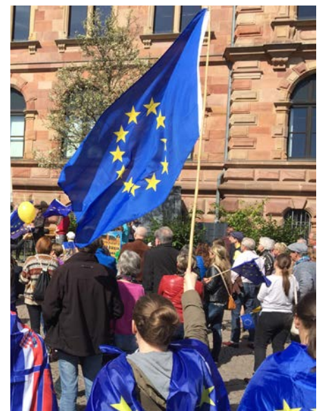
DIE BEWEGUNG „PULSE OF EUROPE“ DEMONSTRIERT IN VIELEN STÄDTEN - WIE HIER IN WIESBADEN - FÜR EINE PROEUROPÄISCHE POLITIK

pagnen gegen Europa wehrten.“ Schäfer-Gümbel forderte: „Sagen Sie endlich klar und deutlich, dass es den Deutschen nur gut gehen kann, wenn es auch den Spaniern, Italienern, Portugiesen und Griechen gut geht. Keine europäische Volkswirtschaft profitiert so sehr vom gemeinsamen Wirtschaftsraum wie unsere.“